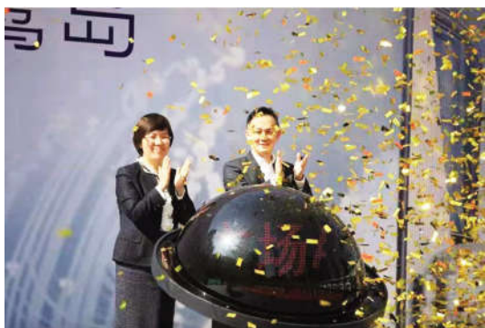
2021 年 3 月,厦门嘉丽广场二期(顶峰中心)项目正式开工建设