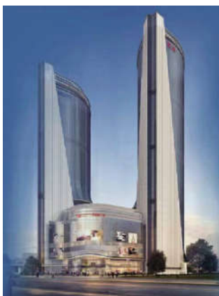
厦门嘉丽广场二期(顶峰中心)效果图