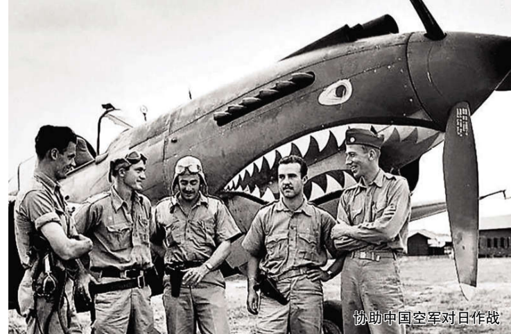
协助中国空军对日作战