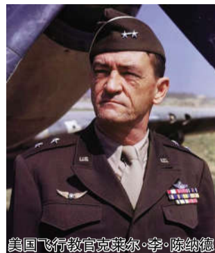
美国飞行教官克莱尔·李·陈纳德