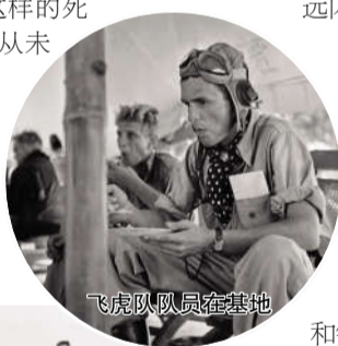
飞虎队队员在基地

飞虎队的故事承载的是中美历久弥新的友谊。战争的硝烟早已散去,但飞虎队的故事却在一代代人的传承中愈加鲜活。中国很多地方都修建了飞虎队博物馆、遗址公园等。很多飞虎队老兵的后代也成为中美关系的有力支持者和推动者。