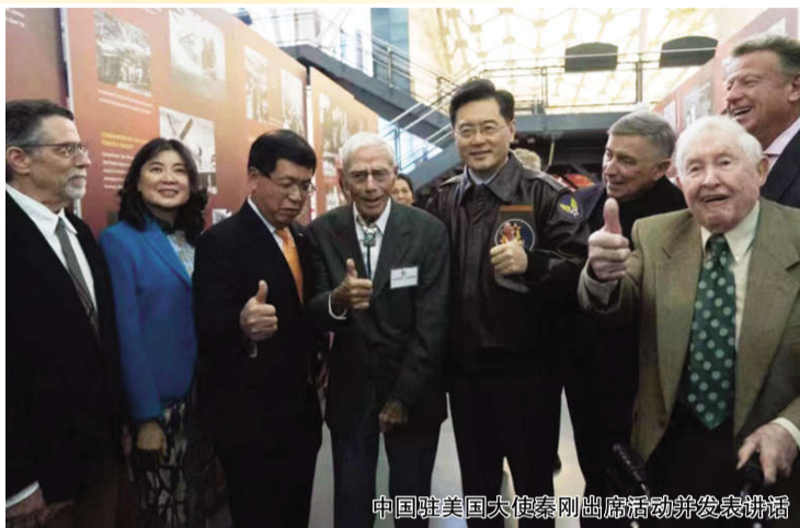
中国驻美国大使秦刚出席活动并发表讲话

飞虎队的故事浓缩的是中美守望相助的情义。当时每个飞虎队员身上带着写有“来华助战洋人,军民一体救护”的血幅,这是飞虎队与中国军民之间的生死契约。一旦发现有着落的美军飞行员,中国老百姓就会不惜代价,全力救助。