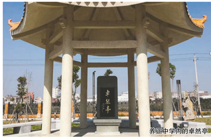
养正中学内的卓然亭