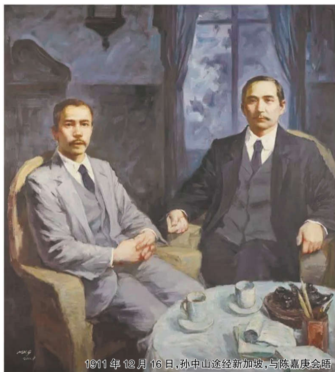
1911年12月16日,孙中山途经新加坡,与陈嘉庚会晤

同德书报社、檳榔屿的檳城阅书报社、马来西亚霹雳的益智书报社、缅甸的觉民阅书报社、古巴的三民阅书报社等。仅荷属东印度的阅书报社就有40多个,缅甸也有10多个。这些阅书报社在宣传民主革命方面也起了很大的作用。