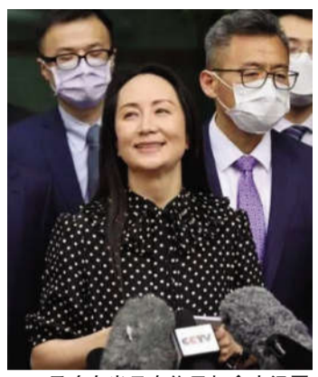
孟晚舟当日在位于加拿大温哥华的不列颠哥伦比亚省高等法院门前向媒体发表声明

孟晚舟在加拿大被捕后,中国政府从一开始就表明立场。中国国务委员兼外交部长王毅在发表演讲时就曾表示:对于任何肆意侵害中国公民正当权益的霸凌