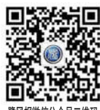
鹭风报微信公众号二维码