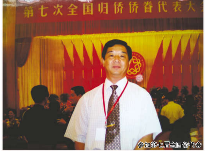
参加第七届全国侨眷代表大会

回国60余年,回国时的情景和成长的经历,像电影一样,一幕幕浮现眼前:在党和国家的培育下,我上学、参军入伍、退伍工作当老师,任农场代理书记、场长、区侨联主席,兼任市人大侨委副主任、市侨联副主席,期间还入团、入党,从一个不懂事的小归侨到处级公务员。没有党和国家,就没有我的今天。我的心中充满感恩之情。