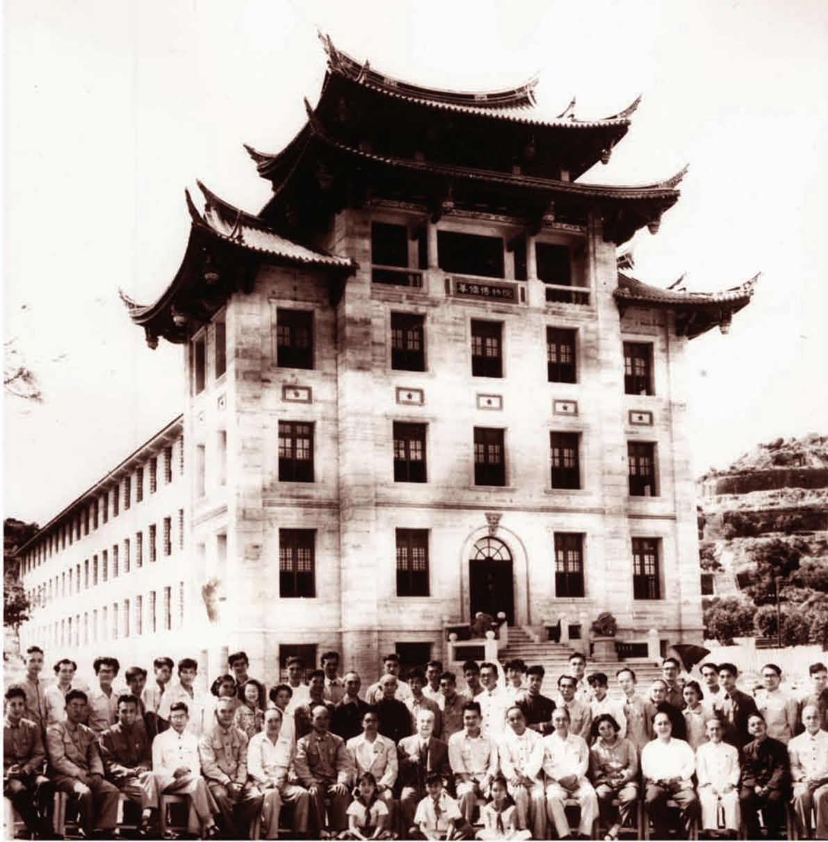
华侨博物院开幕典礼留影