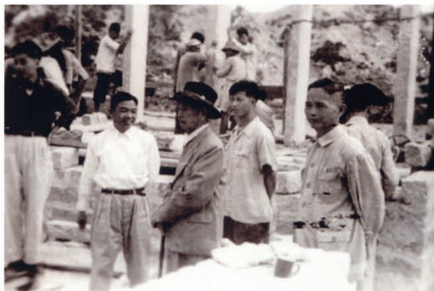
陈嘉庚视察华博工地