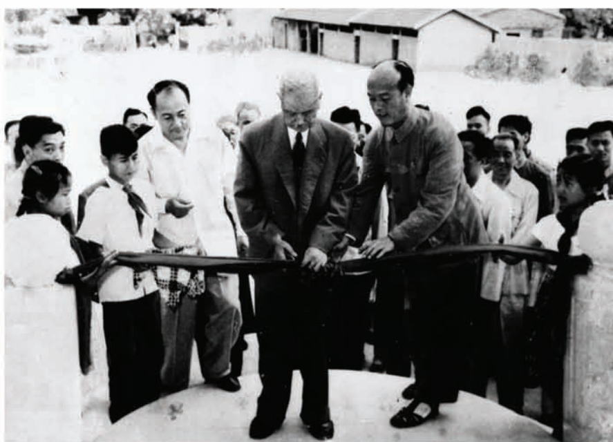
陈嘉庚为华侨博物院开幕式剪彩