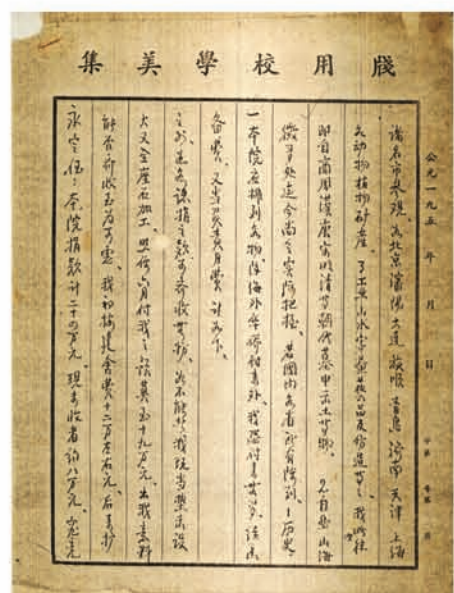
陈嘉庚先生多方设法为华侨博物院征集文物和动物标本等陈列品