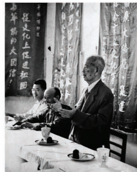
陈嘉庚在华侨博物院开幕式上致辞