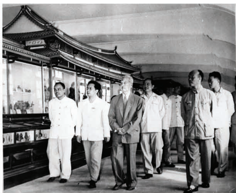
华侨博物院开幕, 陈嘉庚先生同来宾们参观展厅