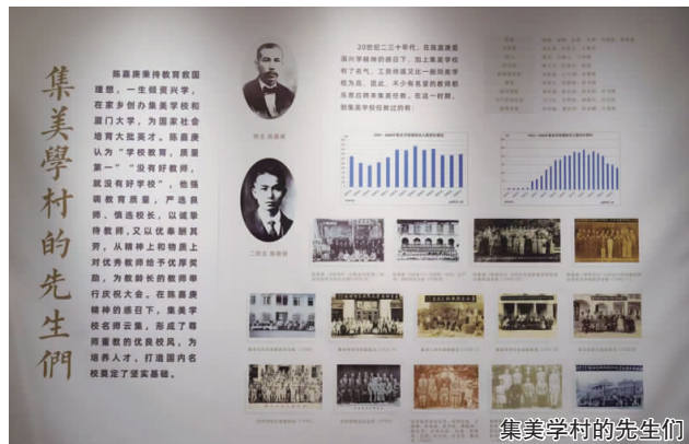
集美学村的先生们

（文/林硕 通讯员 潘荫庭 图/林硕 综合参考资料来源：集美学校委员会、集美文旅）