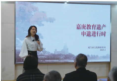
嘉庚教育遗产申遗进度说明