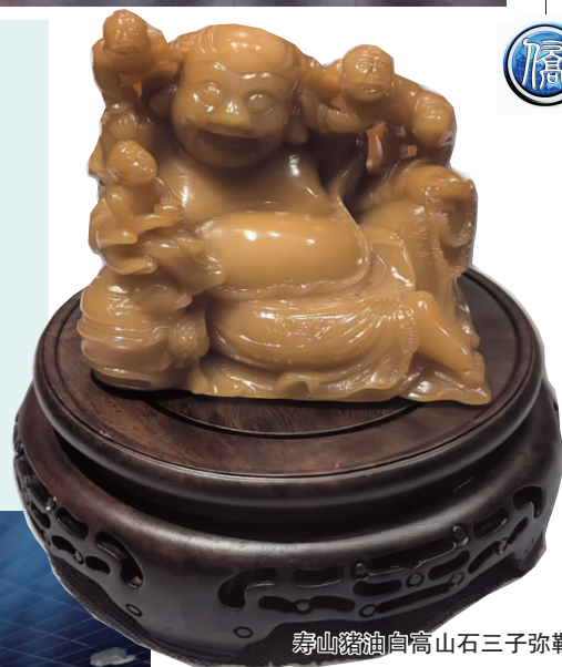
寿山猪油白高山石三子弥勒佛像

展览将持续至 2026 年 1 月 25 日，免费对市民群众开放。（文 / 华博图 / 叶玮玮）