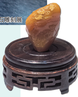
寿山田黄冻石携琴访友薄意章

展览按艺术发展脉络分为“崭露头角”“东成西就”“东西合璧”三部分，分别展示寿山石概况与明以前雕刻、清代西门派与东门派艺术特色、近现代寿山石雕刻的融合创新，展品包括寿山田黄冻石携琴访友薄意章、寿山猪油白高山石三子弥勒佛像等珍品。