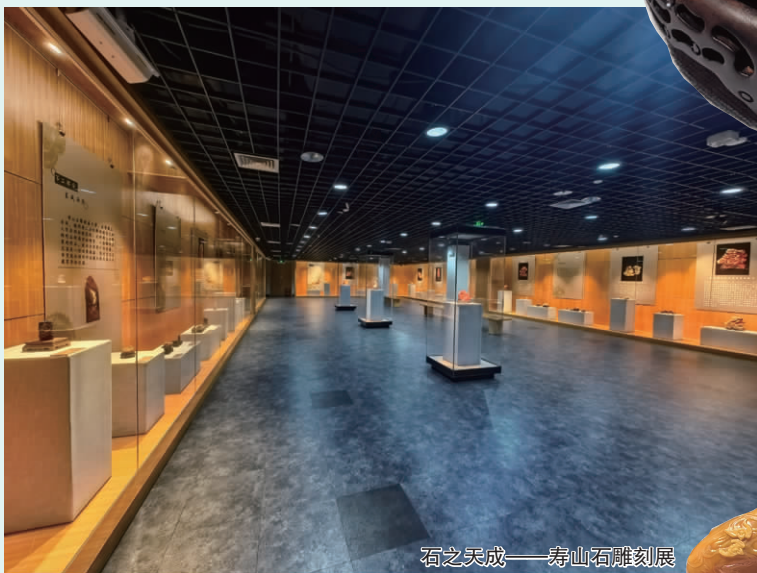
石之天成——寿山石雕刻展

为传承弘扬中华优秀传统文化，加强地域文化交流，丰富市民精神文化生活，12月9日，华侨博物院同步推出两大精品展览：“海上风——嘉兴博物馆藏海派书画展”与“石之天成——寿山石雕刻展”，为观众带来多元的艺术盛宴。