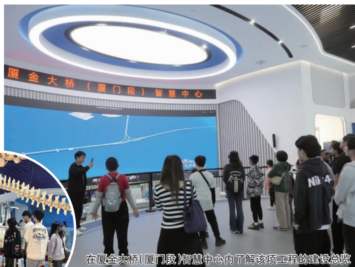
在厦金大桥（厦门段）智慧中心内了解该项工程的建设总览