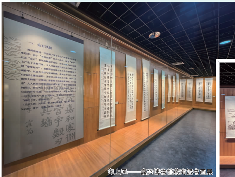
海上风——嘉兴博物馆藏海派书画展